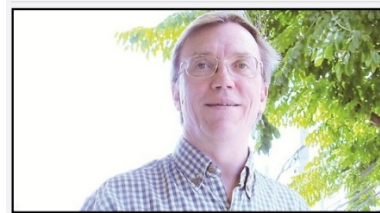
ฝึกพูดภาษาอังกฤษ กับครู (ฝรั่ง) จิตอาสา ฝึกพูดภาษาอังกฤษ กับครู (ฝรั่ง) จิตอาสา : สอนพิเศษคุณครูสอน

สังขย-สิงห์-วัฒนธรรม : ข่าวทั่วไป วันที่ 21 October 2013