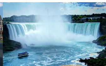
Niagara Falls, New York