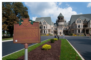
Ohio State Reformatory, Ohio