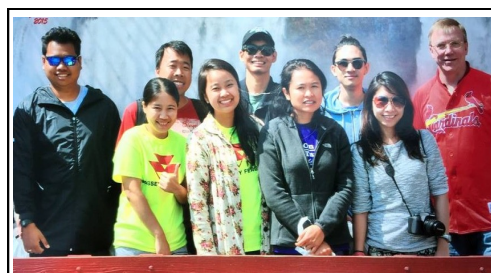
WELCOME HOME, LFNM 2015 TEAM! ขอต้อนรับทีม LFNM 2015 กลับบ้านจ้ะ!