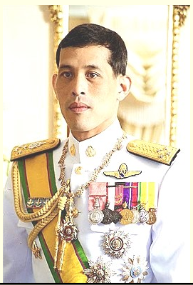
Best Wishes to His Majesty the King on His Royal Coronation!